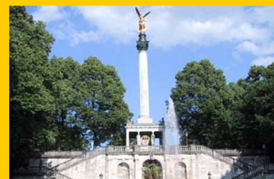
Friedensengel über der Isar