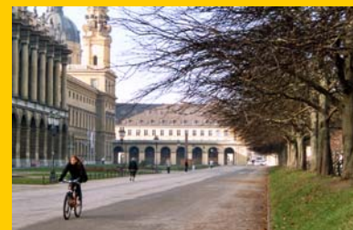
Vom Odeonsplatz durch den Hofgarten zur Bayerischen Staatskanzlei