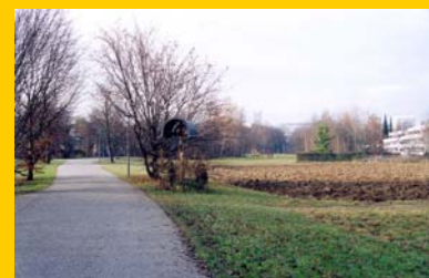
Vom Arabellapark nach Denning durch ländliches Grün